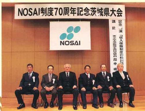
▲ 受賞者等の皆さん