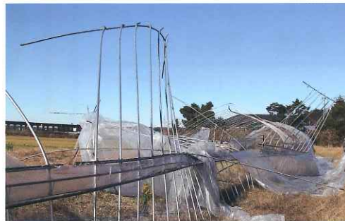
△ハウスの倒壊 (鉾田地区)