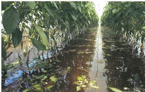
△ ピーマンの水害 (波崎地区)