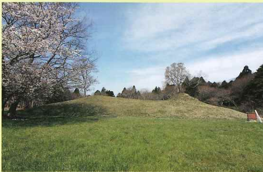
▲ 県指定遺跡「鹿見塚古墳」

「大生古墳群」の被葬者は、鹿島神宮と密接な関係のあったオフ氏一族であり、子子舞塚はその奥津城であったことは各方面から立証されている。古墳周辺は「大生原西部古墳公園」となっており、綺麗に整備されており、春にはさくらの花が公園を彩る。