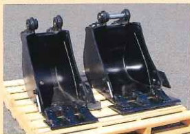
▲左:幅狭バケット、右:標準バケット