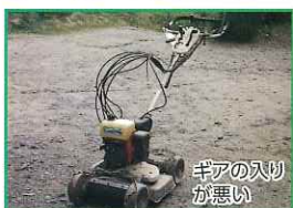
ギアの入りが悪い