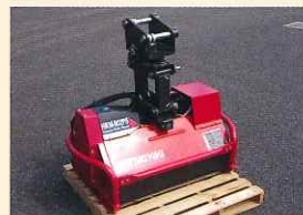
▲草刈機(ハンマーナイフモアー)