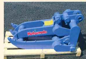
▲機械式フォーク(解体用修了証の所持者に貸出)