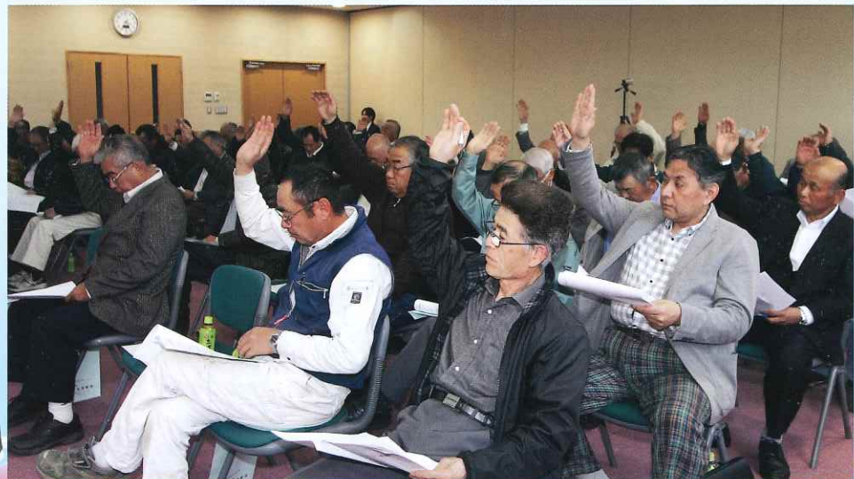
▲平成29年度事業計画・予算等を承認