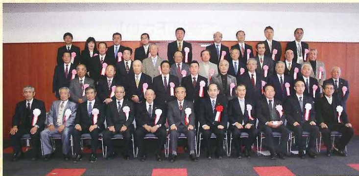
▲ 受賞者等の皆さん