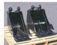
▲ 左: 幅狭バケット 右: 標準バケット