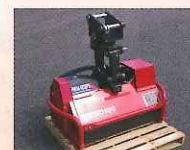
▲ 草刈機 (ハンマーナイフモア)