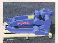
▲ 機械式フォーク (解体用修了証の所持者に貸出)