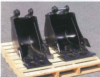
左・幅狭バケット (400 mm) 右・標準バケット (500 mm)