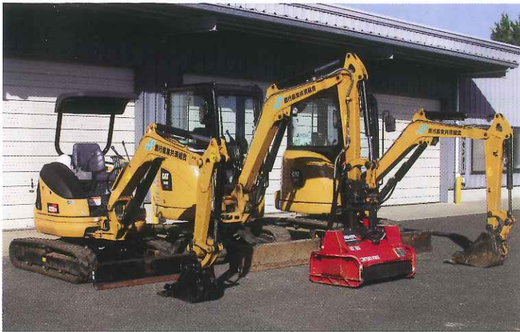
ミニパワーショベル (2t・3t) を貸出します (3台所有)

農家支援事業の一環として、組合員の経営安定に寄与するために、「ミニパワーショベル (2t・3t)」の貸出を実施しております。