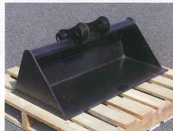
法面バケット (1,000 mm)