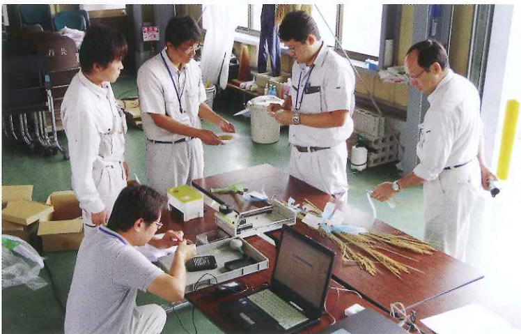
乳白米検査をする職員

整粒歩合により等級が決まりますので【70%以上を一等米・60%以上を二等米・45%以上を三等米】組合管内においては、全ての調査圃場で良好という検査結果が出ました。