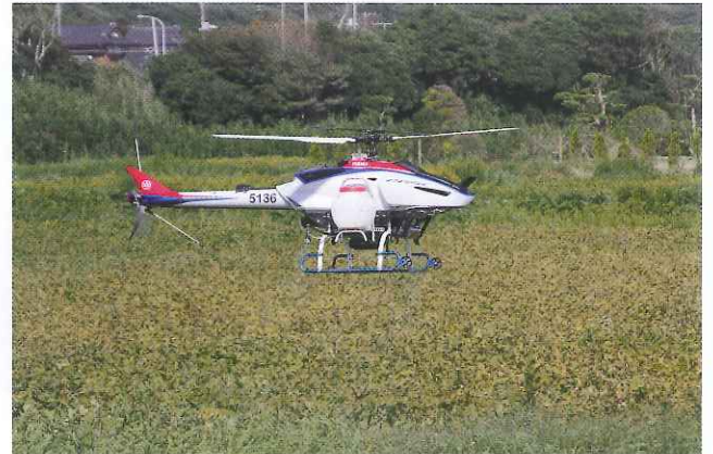
無人ヘリ空中防除（鹿嶋市清水地区）

今後のさらなるニーズに応えるため、職員の免許取得者を4人増員し損害防止に努めてまいります。