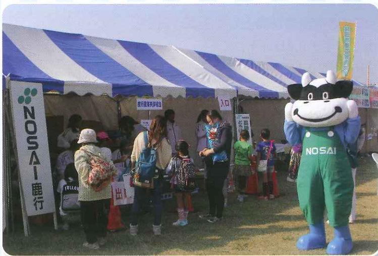
「金魚すくい」コーナーは、大盛況でした

秋晴れの中、「銚田うまかっぺフェスタ'15」が2日間開催され、大勢の来場者が訪れ盛大のうちに終了しました。組合では恒例の「金魚すくい」コーナーを設け、2日間で約1,000名の方々と交流を深め、約4,200匹の金魚を配布しました。また、当日募金をしてくださった皆さん、ありがとうございました。当日集まった募金(10万,550円)は、11月4日に銚田市役所を訪れ全額寄付させていただきました。