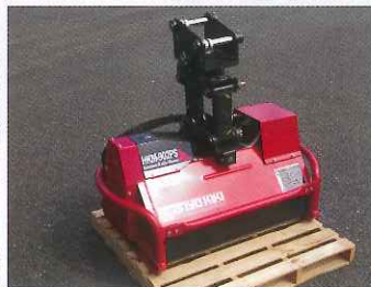
草刈機 (ハンマーナイフモーター)