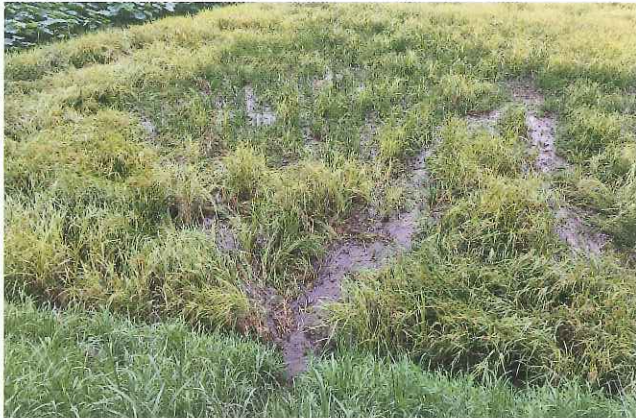
イノシシの被害（行方市北浦地区）

被害面積は昨年度より拡大したと思われます。イノシシは一度餌場と認識したら繰り返しやってくるので、ネット柵や電気柵など効率的なイノシシ対策が必要です。