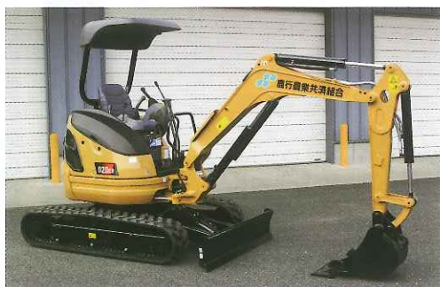
▲ 2tを新たに導入しました。

農家支援事業の一環として、圃場や用水路等の整備に活用していただき、災害の未然防止・生産性の向上及び労力軽減を支援することを目的に「ミニパワーショベル(2t・3t)」の貸出及び「小型・車両系建設機械(3t未満)」の講習会をおこなっております。貸出利用には小型車両系建設機械運転資格(修了証)が必要になりますので、ぜひ講習会を受講してください。