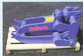
▲機械式フォーク(解体用修了証の所持者に貸出)