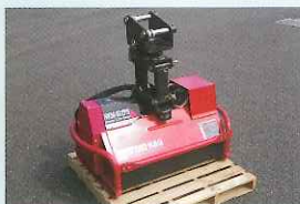
▲草刈機(ハンマーナイフモアー)