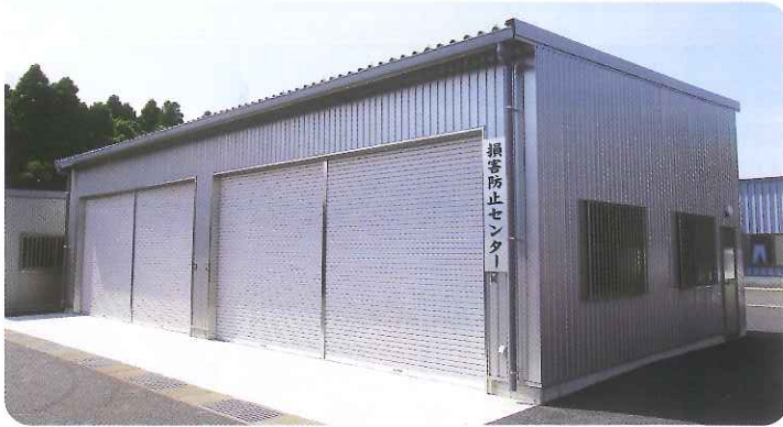
▲ 完成した「損害防止センター」

損害防止センターが6月上旬に完成し、関係者多数ご臨席のもと、6月12日同センターにおいて竣工式が執り行われました。 今後、さらなる農家ニーズに応えるため、無人ヘリ航空防除等の、損害防止の拠点として利用されます。