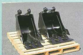
▲左幅狭バケット、右標準バケット