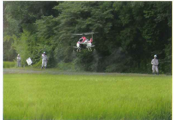
▲ 無人ヘリ空中防除(銚田市大洋地区)

今後、免許取得者を増員し良質米生産のため、各関係団体と協力し、散布地区・散布面積を拡大し損害防止に努めてまいります。