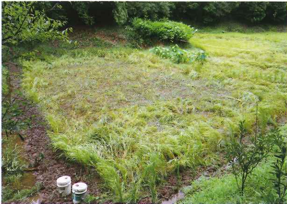
▲ イノシシの被害(行方市北浦地区)

被害面積は計74.8aで、今後拡大すると思われます。イノシシは一度餌場と認識したら繰り返しやってくるので、ネット柵や電気柵など効率的なイノシシ対策が必要です。