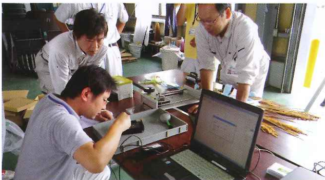
▲ 乳白米検査をする職員