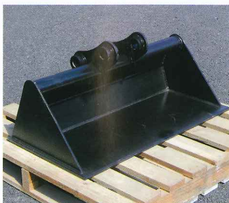
▲ 法面バケット (1,000mm)