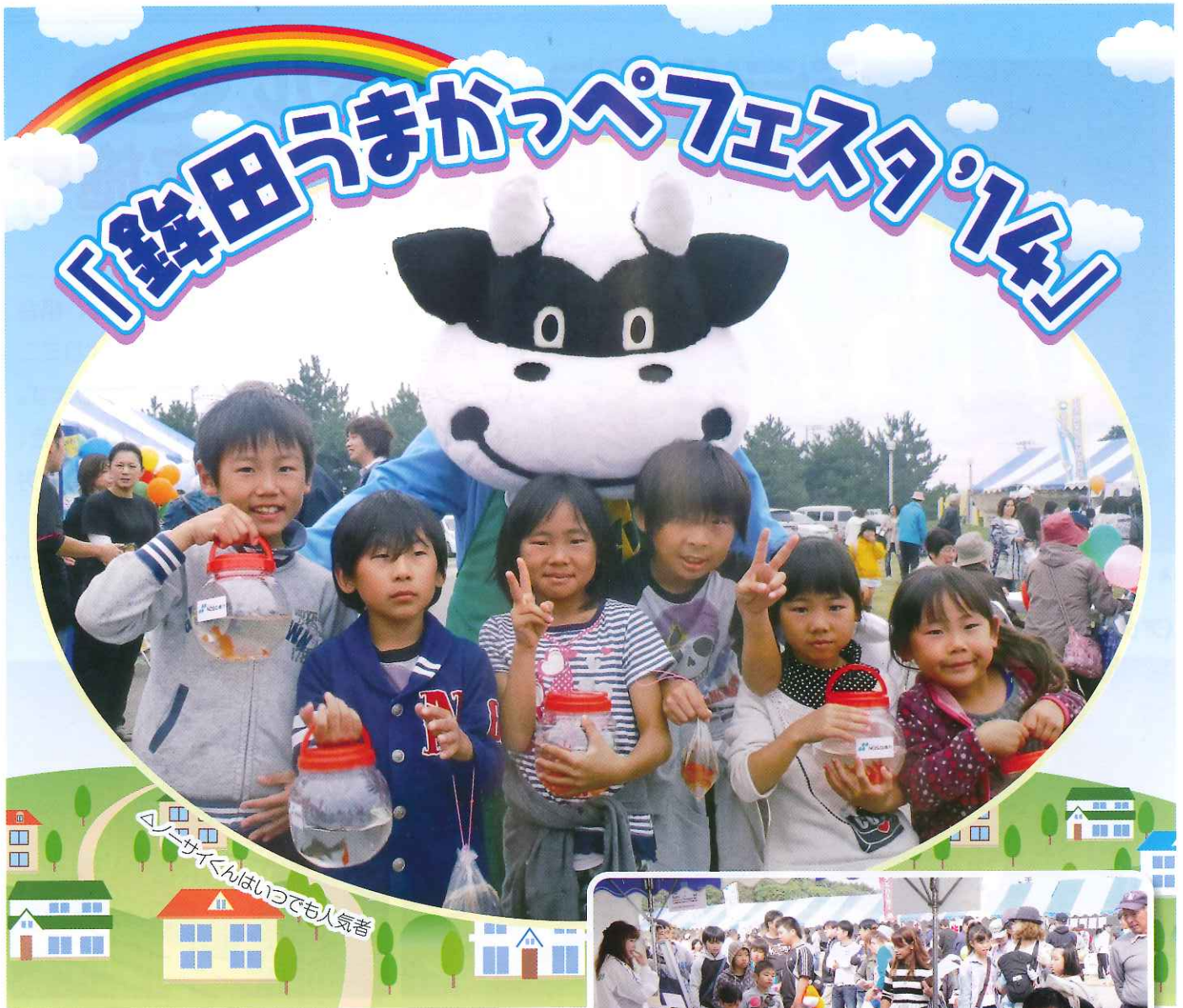
「金魚すくい」はいつでも人気者

「信頼のきずな」未来を拓く運動の一環として、組合のPRを目的とした地域イベント等への参加をしています。