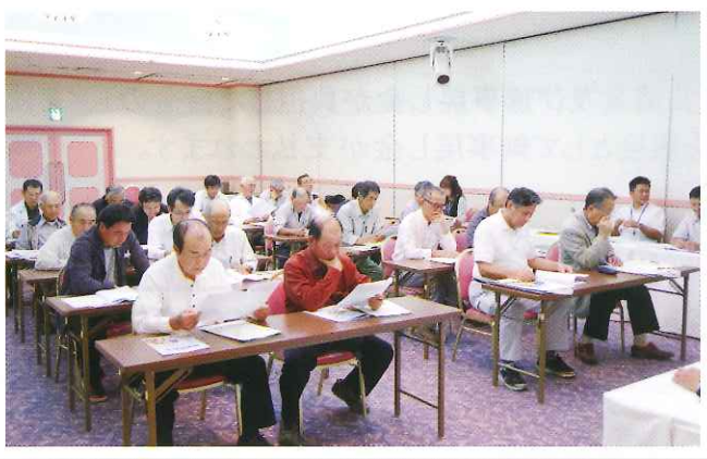
▲ 潮来地区事業推進会議

今年も、組合で作成した各共済事業・損害防止事業・農家支援事業・NOSAI鹿行女性の会等を解りやすく紹介したDVDを視聴し、その後会議では、建物・農機具共済加入推進・コンプライアンス等についての説明が行われました。