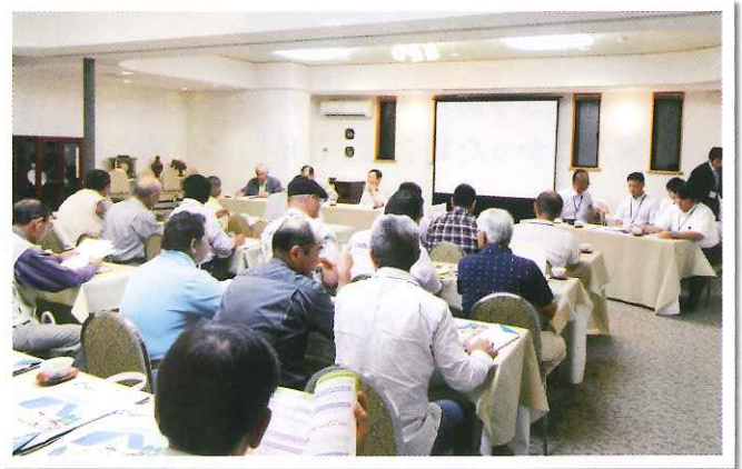
▲ 麻生地区事業推進会議