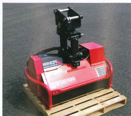
▲ 草刈機 (ハンマーナイフモアー)