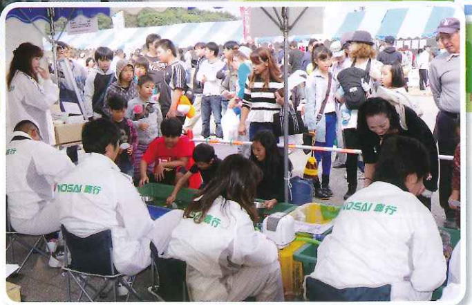
「金魚すくい」コーナーは大人気

今年も10月12日～13日に鹿島灘海浜公園で開催された「銚田うまかっぺフェスタ'14」に参加しました。