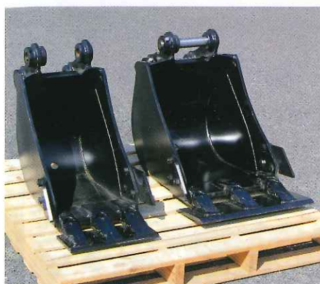
▲ 右・標準バケット (500mm) 左・幅狭バケット (400mm)

《アタッチメントの種類》 ※1回の貸出は本体1台と付属品1種類のセットとなります。