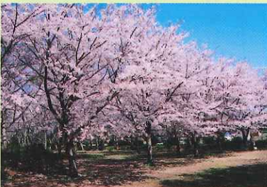
▲ 見事に咲き誇る「ソメイヨシノ」