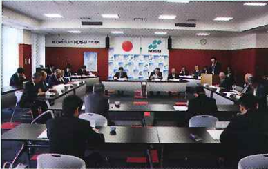
▲ 第5回協議会の様子