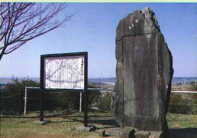
▲ 本丸跡にある石碑と解説板

鹿島城(吉岡城)跡は鹿島神宮の西側、鹿島神宮駅にほど近い大地に跡地が存在する。城は常陸大掾氏の碑一族、鹿島三朗成幹の子、政幹がこの地に移り住み吉岡城を築城したことに始まり、鎌倉時代初期約八〇〇年前から、室町時代の約四〇〇年間、鹿島氏の居城であった。かつて鹿島城の縄張りには、現在の鹿島神宮二の鳥居のあたりまであったとされる。その後、天正十九年(一五九一年)に佐竹氏に虐殺され「南方三十三館の謀殺」後、兵を向けられ落城する。