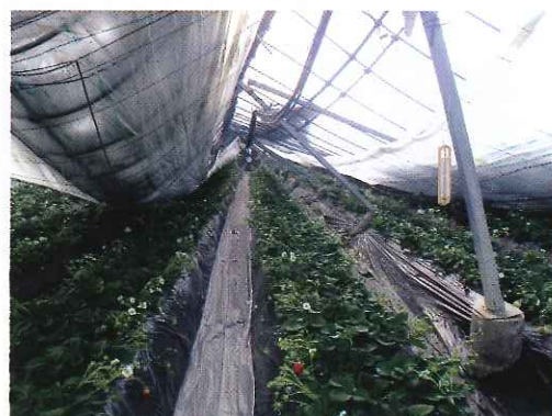
▲大型連棟ハウスも倒壊