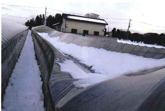
▲各地区で全損被害が発生

組合管内では、2月8日から9日及び14日から15日の二週続けて、南岸低気圧の通過と上空の寒気の影響により雪・風(鹿嶋市/25.7m/s)が強まり、記録的な大雪等となった。