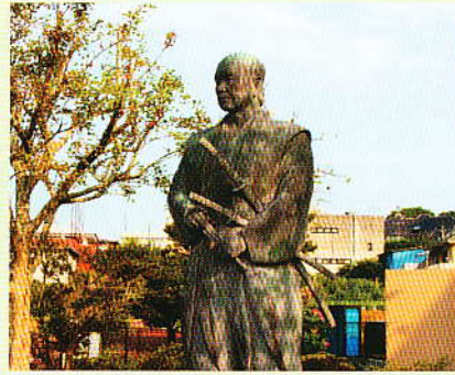
▲鹿島神宮駅前の「塚原ト伝」の像

塚原ト伝は、今から約五百年前の、戦国時代の剣豪です。延徳元年（二四八九）常陸国（現在の鹿嶋市）に鹿島神宮の神職ト部吉川家の次男として生まれ、幼名を朝孝（ともたか）といい、塚原城の城主塚原土佐守幹（とさのかみやすも）の家に養子に行き、塚原新右衛門高幹（しんうえもんたかもと）と名乗った。ト伝は生涯で三度の廻国修行をしている。