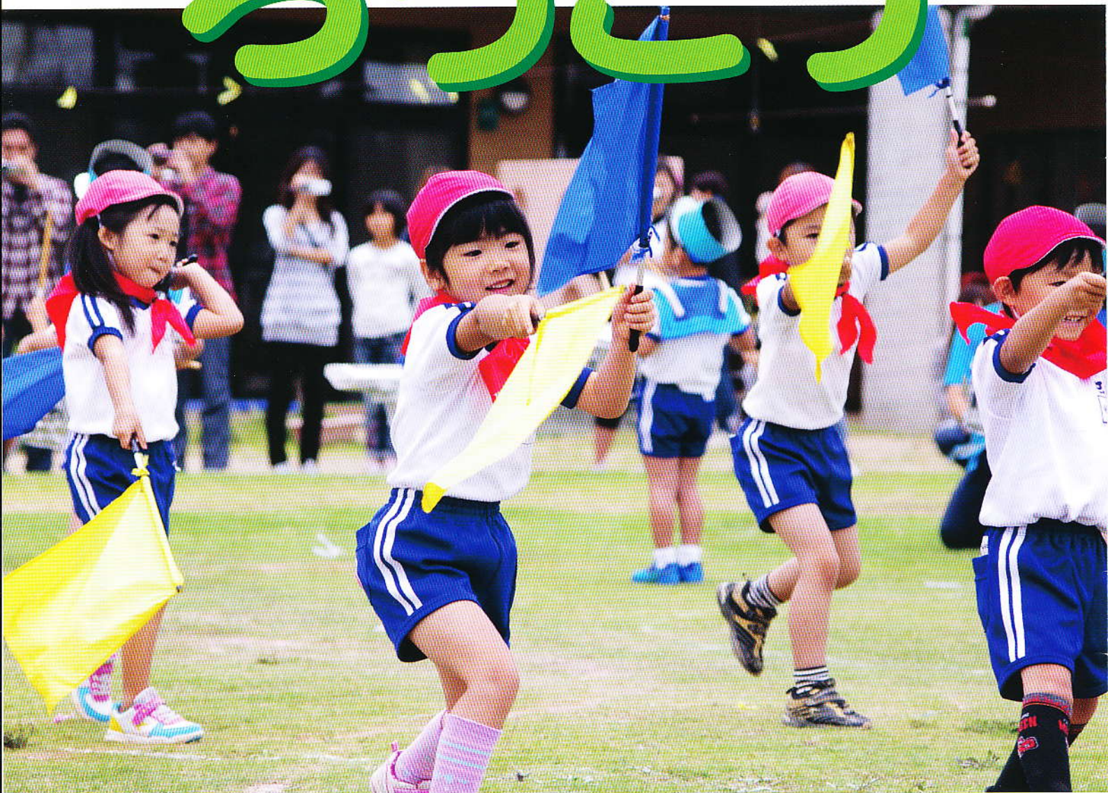
神栖市「海浜保育所運動会」