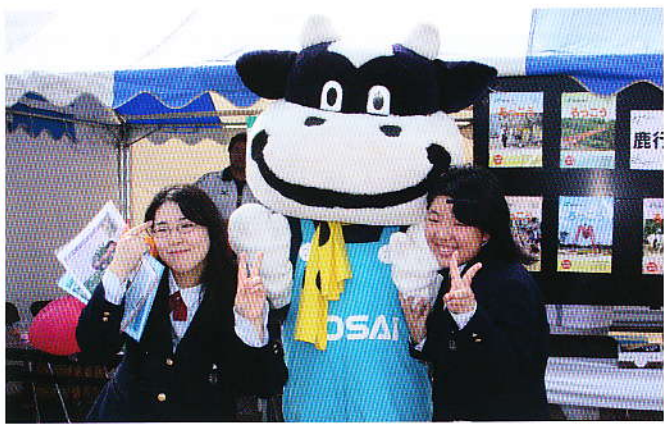
▲女子高生と記念写真