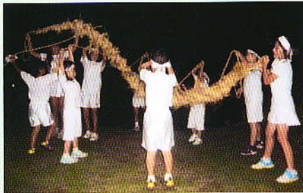
△ 大きな声でがんばります

また、子供会会長は、「この伝統ある行事を絶やさすことなく、後世に伝えて行きたい」と話してくれました。