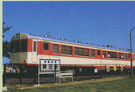
ほっとパーク銚田に保存されている「キハ601 車両」

1921(大正10)年10月12日に要村(行方市)出身の実業家で代議士の高柳淳之介を発起人とする石岡町(石岡市)の有力者らが「行方鉄道株式会社」を設立し、1924(大正13)年6月3日に「鹿島参宮鉄道」として、石岡と常陸小川間の営業を開始したのが始まりである。その後1929(昭和4)年5月16日ついに石岡と銚田間27.2キロが全線開通した。1979(昭和54)年4月1日に関東鉄道の子会社、「鹿島鉄道」となった鉄道は、葉タバコをはじめとする農作物、百里基地へのジェット燃料輸送、学生の通勤など多くの方に利用されてきたが、営業収入の基幹であったジェット燃料輸送(年間約1億の貨物収入)が、2002(平成14)年3月限りで廃止され経営は悪化した。親会社や茨城県と沿線自治体が財政支援し、何とか運行していたが、2007(平成19)年3月31日限りで、開業以来83年の歴史に幕を閉じた。