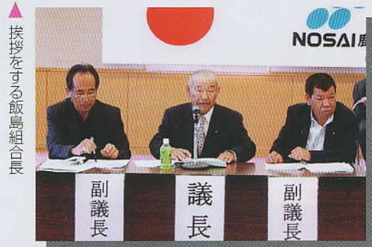
▲挨拶をする飯島組合長