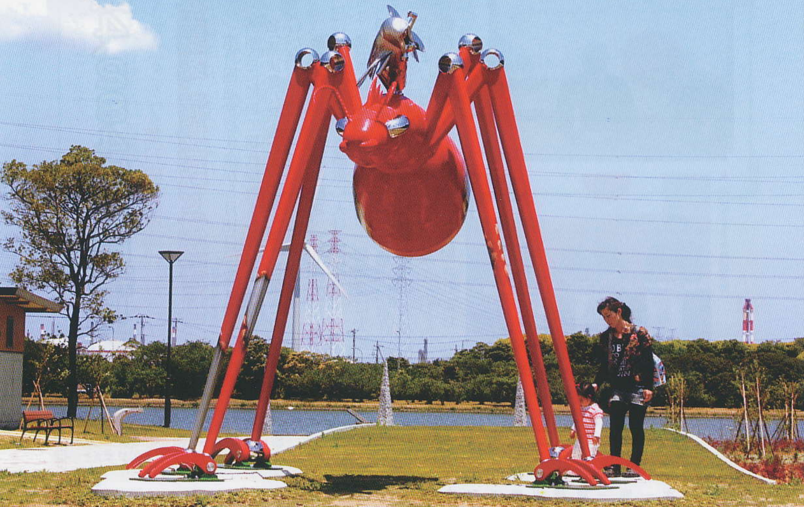
巨大アリのモニュメント『プラアントくん』（神栖市…神之池緑地公園）