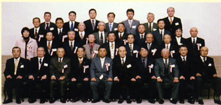
農業共済功績者表彰伝達式

※第1号表彰は共済部長・損害評価員等として農業共済事業の運営と進展に功績のあった人 第2号表彰は永年に亘り役員として功績のあった人