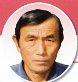
銚田市台濁沢 【共済部長】

今年は、年男として節目の年なので、健康など日々の生活に注意し、安全でおいしいお米をつくっていかうと思います。