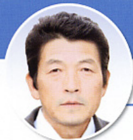
銚田市舟木 【損害評価会委員】