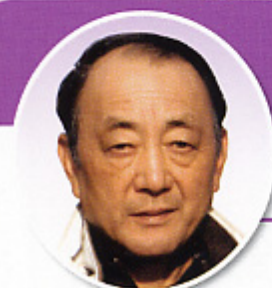
神栖市下幡木 【損害評価員】

共済役員に関わり、地域の皆様の御指導又組合員の方々の協力を頂きながら早いもので、三年有難うございました。今年還暦を迎え、健康に注意し家族と協力し合い、又農業に従事、安心・安全をモットーに新鮮で美味しい農産物を作り届けられたら最高ですね。