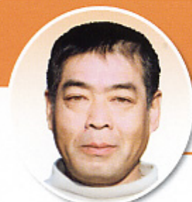
鹿嶋市中 【共済部長】

モ〜4回目の年男になってしまいました。年月が過ぎるのは早いもので、私どももそろそろ健康に気をつけないと行けない年になってきました。私を含め家族が健康で暮らせる事を願うばかりです。昨年は「交」と言う年とか聞きますが、今年は皆さんにとって良い年でありますように。