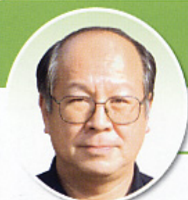
鹿嶋市田野辺 【共済部長】

今年還暦を迎えますが、これからも地域の皆様の御指導を頂きながら、日々健康に注意し、妻と力を合わせて農業に従事し、頑張っていきたいと思えます。