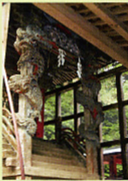
一本造の龍の彫刻

本殿は小柄ではあるがまとまっていることと、向拝柱の龍の彫刻は精巧であり、一本の柱をくりぬいた珍しい手法の作となっていることから、昭和四十三年三月に県の重要文化財に指定されている。