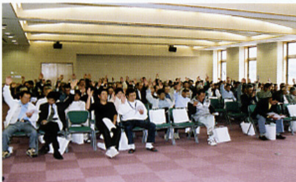
総代全員挙手により議案が承認